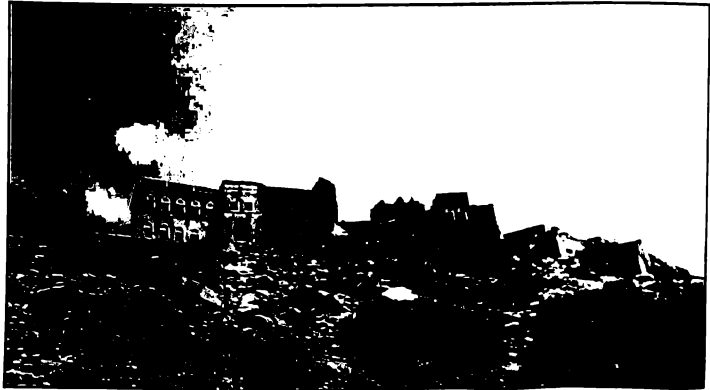
منزل الشيخ هلال بن نبهان البحري / العلياء