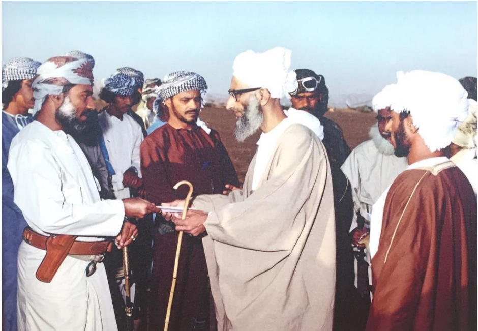
الشيخ سالم مُسلِّمًا السلطان قابوس رسالةً داعيًا إياه فيها إلى طباعة جامع ابن جعفر