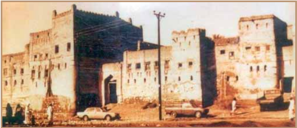
حارة الوادي الغربية