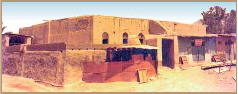
جامع عقر نزوى