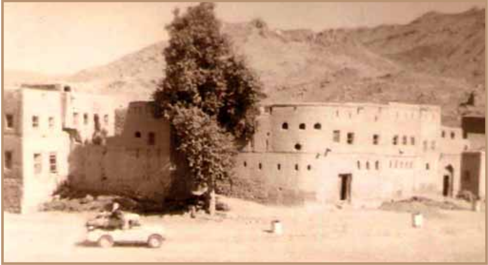
حارة الوادي الشرقية