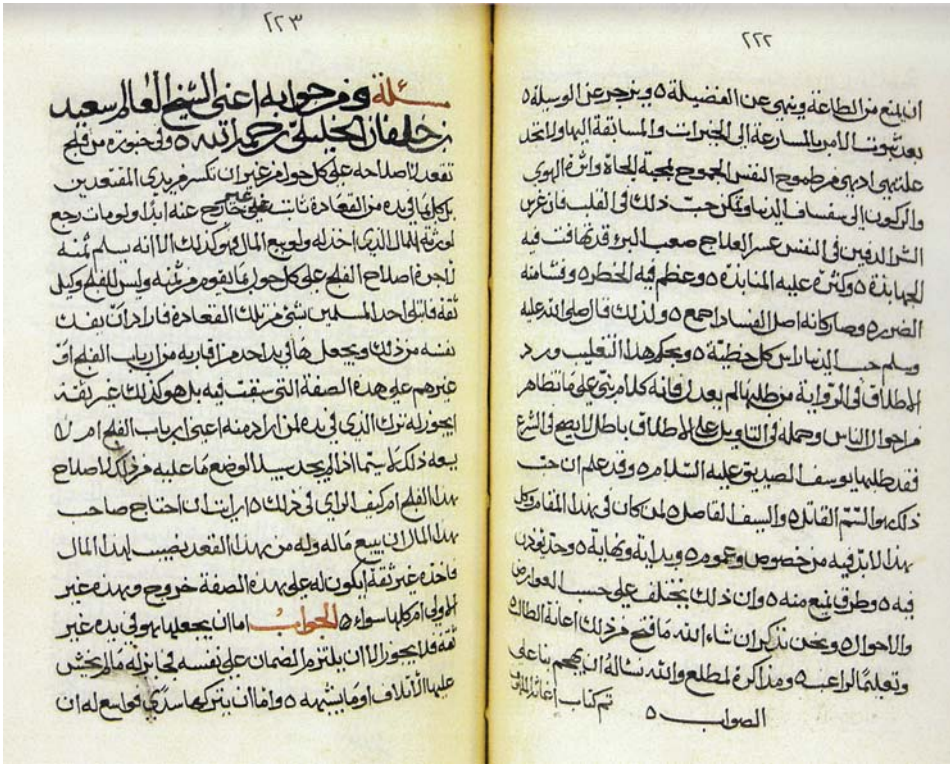
الصفحة الأخيرة من مخطوط إغاثة الملهوف نسخة مكتبة الشيخ سالم بن حمد الحارثي