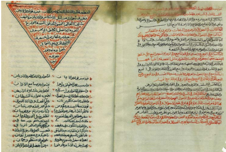
الصفحة الأولى من القطعة الثالثة نسخة مكتبة الشيخ عبد الله بن محمد الخروصي