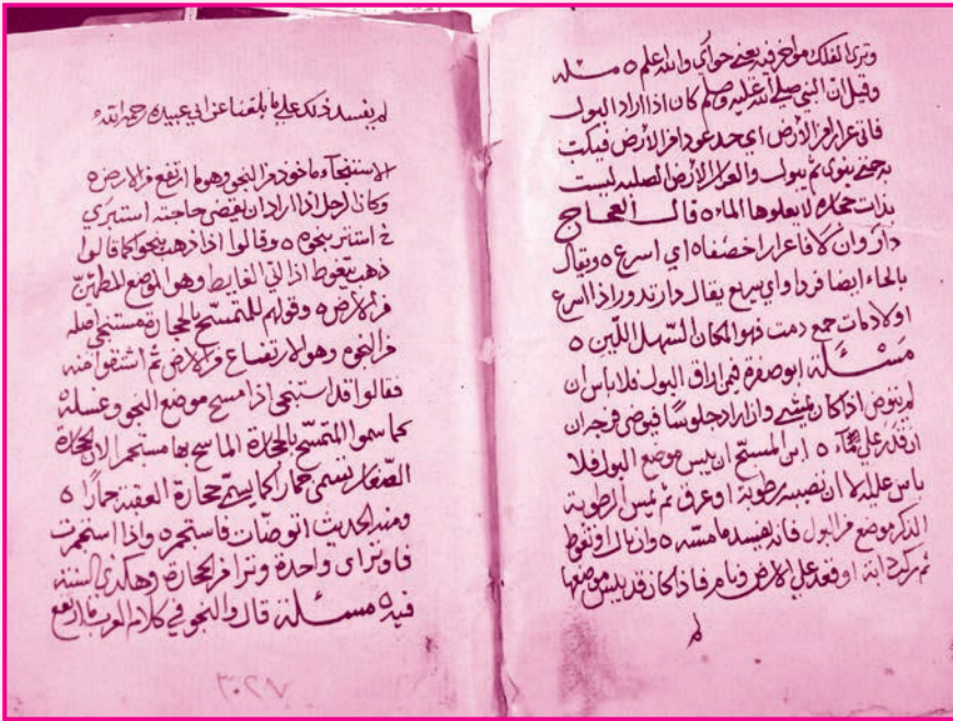
الصفحة الأخيرة من الجزء الرابع (أ) - وزارة التراث والثقافة، سلطنة عُمان