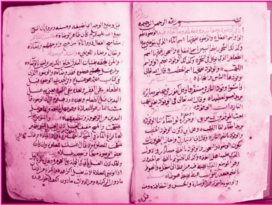
الصفحة الأولى من الجزء الرابع (ج) - وزارة التراث والثقافة، سلطنة عُمان