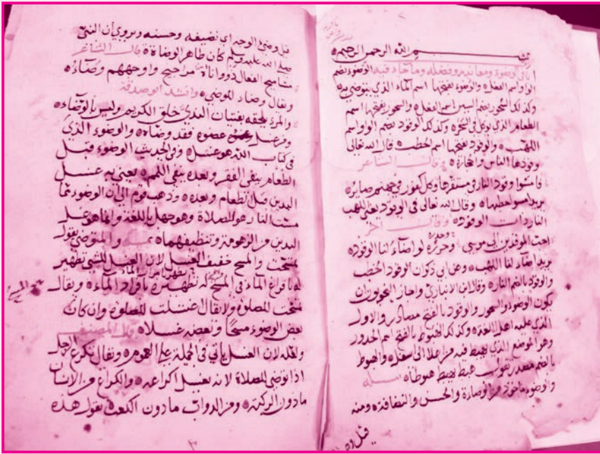
الصفحة الأولى من الجزء الرابع (أ) - وزارة التراث والثقافة، سلطنة عُمان